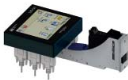
MT-HP4 KOMPAKTE EINHEIT MIT 1-PEN DRUCKKOPF (1/2")

Zubehör zur Montierung des MiniTouches kann gesondert angefordert werden.